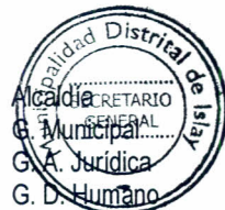
Imagen Informática Archivo.